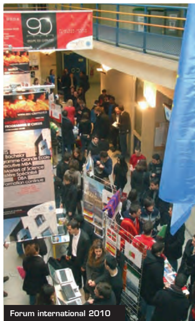
Forum international 2010

Dans le même temps, 219 élèves de l'ESC Clermont s'apprê- taient à rejoindre une trentaine de pays. Une majorité d'élèves de 2 e année du programme ESC s'absente au cours du 2 e semestre dans le cadre du séjour académique. Parmi les trente et une destinations pays, le Mexique, la Chine, les USA, l'Espagne, l'Allemagne et le Royaume-Uni sont les plus demandées en 2010.