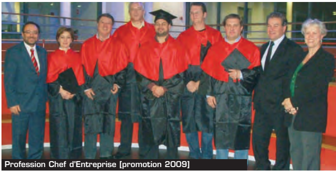
Profession Chef d'Entreprise [promotion 2009]

Ces dirigeants d'entreprises de la région Auvergne ont choisi de consacrer vingt-six journées de leur temps précieux à douze séminaires sur les problématiques de l'entreprise, animés par des intervenants de haut niveau du Groupe ESC Clermont. Des échanges intensifs où le partage d'expériences, sur des secteurs d'activités différents, tient une large place.