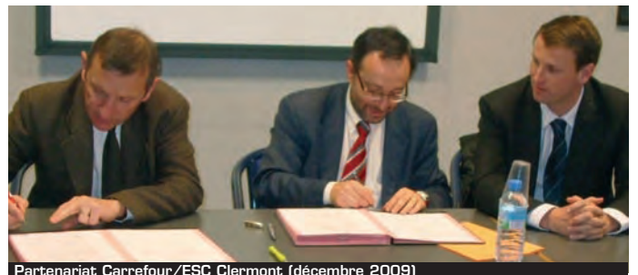
Partenariat Carrefour/ESC Clermont (décembre 2009)