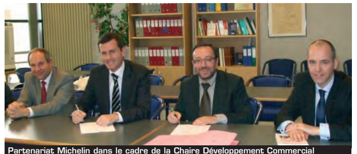
Partenariat Michelin dans le cadre de la Chaire Développement Commercial