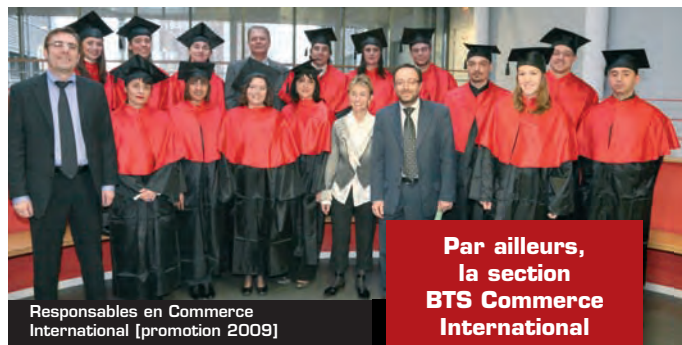
Responsables en Commerce International [promotion 2009]

français à dispenser la formation de Responsable en Commerce International (ReCI) dont le Titre national, enregistré au Répertoire des Certifications Professionnelles à Niveau II (bac +3/4) est délivré par l'ACFCI (Assemblée des Chambres Françaises de Commerce et d'Industrie).